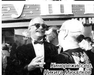
Кинорежиссер Никита Михалков