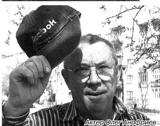
Актер Олег Анофриев