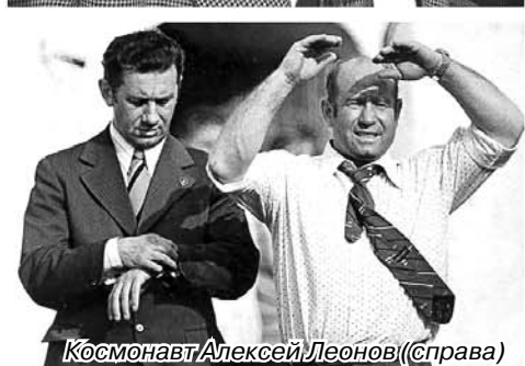
Космонавт Алексей Леонов (справа)