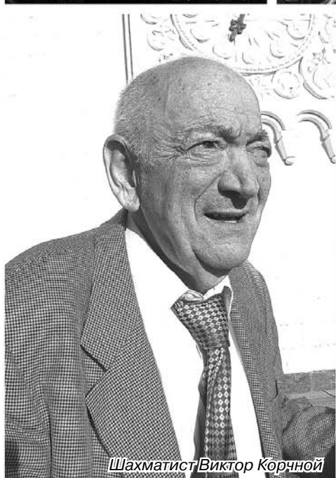
Шахматист Виктор Корчной