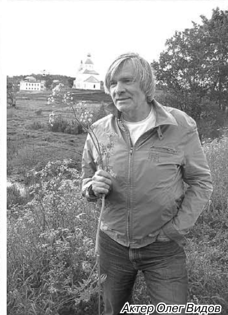
Актер Олег Видов