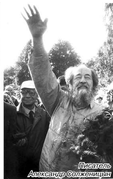
Писатель Александр Солженицын