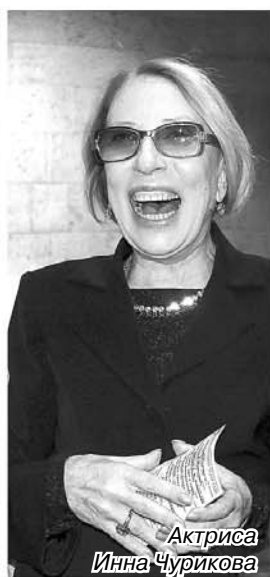
Актриса Инна Чурикова