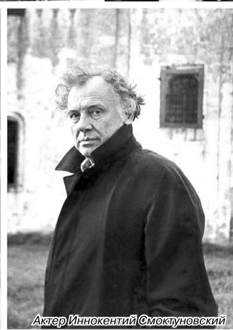
Актер Иннокентий Смоктуновский