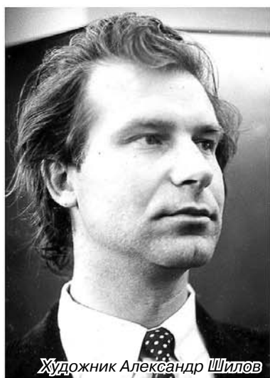
Художник Александр Шилов

Предлагаем вашему вниманию малую часть коллекции автора.