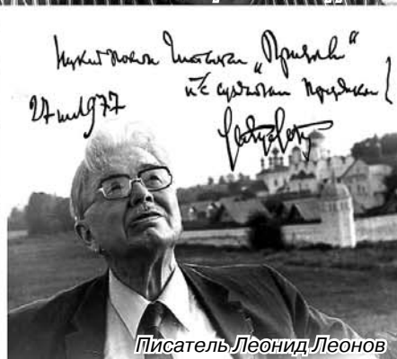
Писатель Леонид Леонов