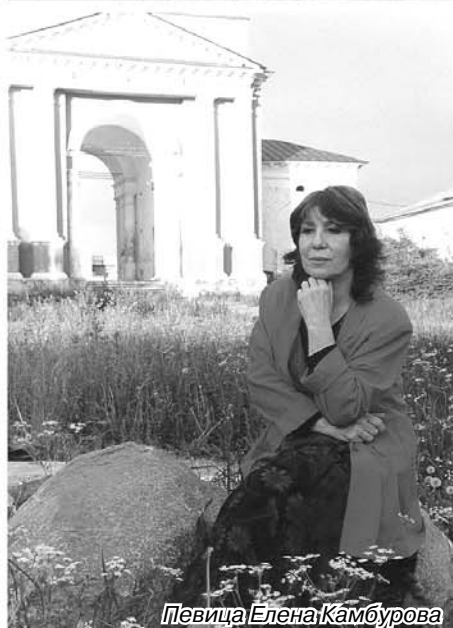
Певица Елена Камбурова