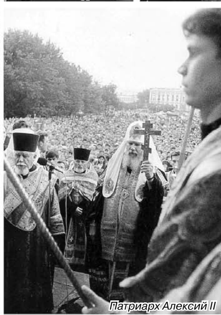
Патриарх Алексий II