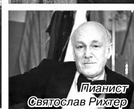
Пианист Святослав Рихтер